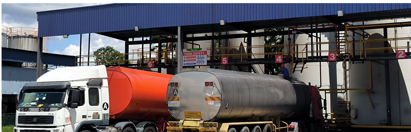
装货区 · 油厂罐车