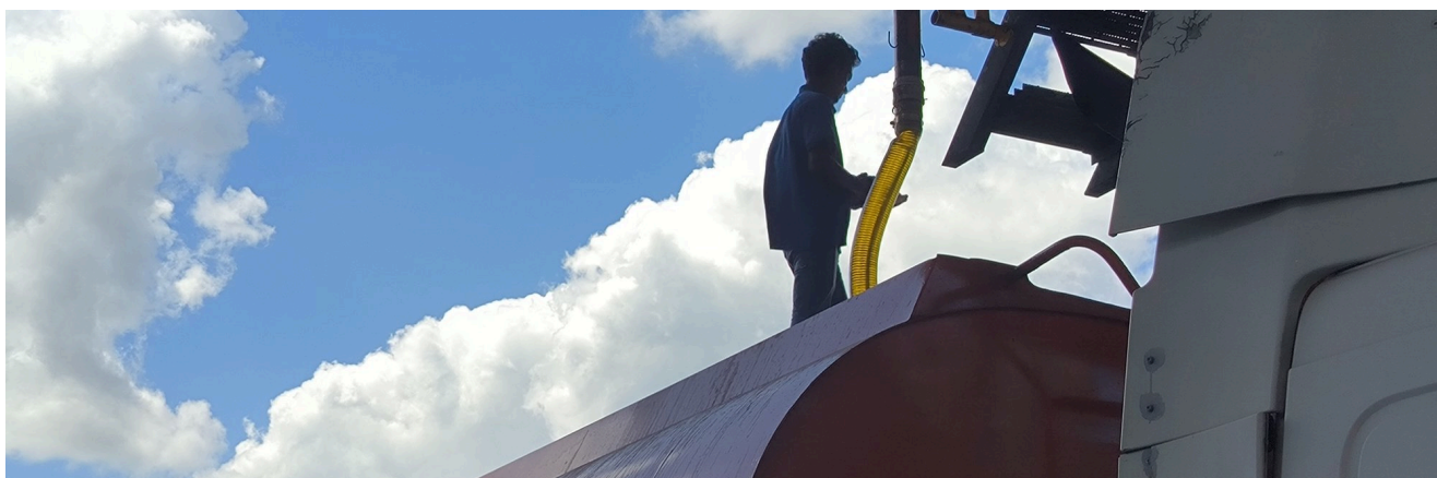
CPO 装车 · 油厂散装罐车

原料采自马来西亚各地持有 MPOB 牌照的棕榈油厂。本地供应炼油厂，海外则以散装货形式发运。规格于装车装船前确认。